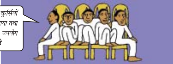
वगैर निर्धन तथा अमीर वाले देश

हमने कुर्सियों को बनाया तथा उनका उपयोग करते हैं