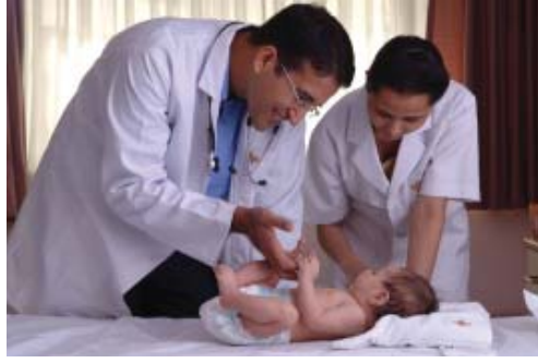
अधिकांश शिशुओं को बुनियादी स्वास्थ्य सुविधाएँ भी नहीं मिल पातीं

यह तालिका क्या दर्शाती है? तालिका का पहला स्तंभ दिखाता है कि केरल में 1000 जीवित पैदा हुए बच्चों में से 11 बच्चे 1 वर्ष की आयु तक पहुँचने से पहले मर जाते हैं, लेकिन पंजाब में यह अनुपात 49 है जो केरल की तुलना में लगभग 5 गुना है। दूसरी ओर पंजाब की प्रतिव्यक्ति आय केरल से कहीं ज्यादा है जैसा तालिका 1.3 में दिखाया गया है। ज़रा सोचिए कि अपने माता-पिता के लिए आप कितने प्यारे हैं, यह सोचिए कि सब लोग कितना प्रसन्न होते हैं, जब कोई बच्चा जन्म लेता है। अब ऐसे माता-पिताओं के बारे में सोचिए जिनके बच्चे अपने पहले जन्म दिन से पहले ही मर जाते हैं। ऐसे माता-पिताओं को कितना दुख महसूस होता होगा। दूसरा, यह देखिए कि यह आँकड़े किस वर्ष के हैं। यह वर्ष 2003 के हैं। तो हम बहुत पुराने समय की बात नहीं कर रहे हैं; यह हमारी स्वतंत्रता के 56 वर्ष बाद की बात है जब हमारे देश के बड़े शहर