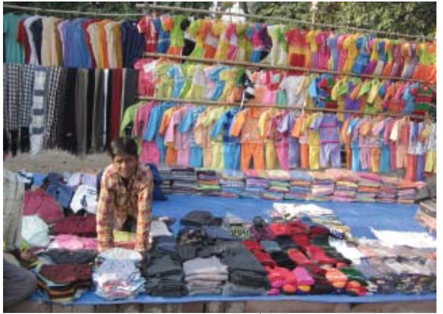
सिलेसिलिए वस्त्रों के छोटे व्यापारी बहुराष्ट्रीय कंपनियों के ब्रांड और आयात दोनों से कड़ी प्रतिस्पर्धा का सामना करते हुए।

सामान्यतः व्यापार के खुलने से वस्तुओं का एक बाज़ार से दूसरे बाज़ार में आवागमन होता है। बाज़ार में वस्तुओं के विकल्प बढ़ जाते हैं। दो बाज़ारों में एक ही वस्तु का मूल्य एक समान होने लगता है। अब दो देशों के उत्पादक एक दूसरे से हजारों मील दूर होकर भी एक दूसरे से प्रतिस्पर्धा कर सकते हैं। इस प्रकार, विदेश व्यापार विभिन्न देशों के बाज़ारों को जोड़ने या एकीकरण में सहायक होता है।