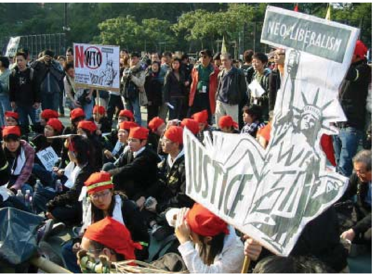
हांगकांग में डब्ल्यू.टी.ओ. के खिलाफ प्रदर्शन-2005