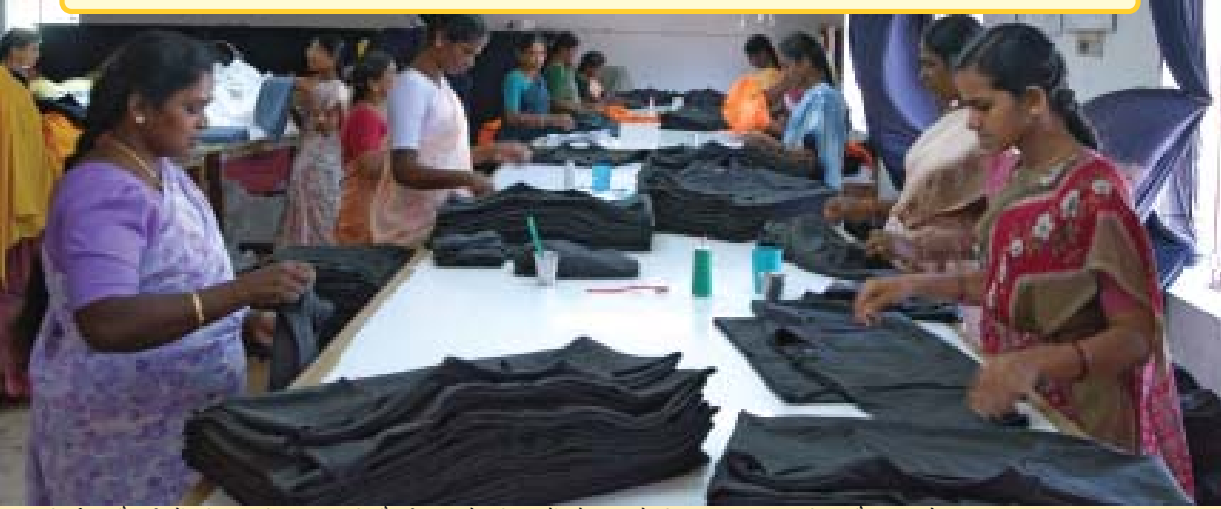
वस्त्र निर्यातक फैक्ट्री में महिला श्रमिक – यद्यपि वैश्वीकरण ने महिलाओं को काम के लिए अवसर प्रदान किया है, परन्तु रोज़गार की स्थितियाँ यह प्रदर्शित करती हैं कि महिलाओं को लाभ में भागीदारी समुचित रूप से नहीं मिली।

अब हम देखते हैं कि भारत में वस्त्र निर्यात उद्योग प्रतिस्पर्धा के दबाव को कैसे सहन कर रहे हैं?