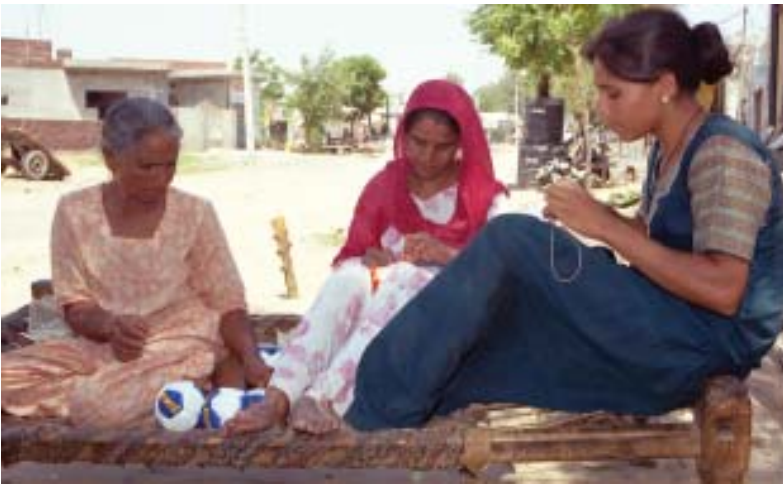
लुधियाना के एक घर में एक बड़ी बहुराष्ट्रीय कंपनी के लिए फुटबाल-निर्माण का चित्र

इस प्रकार, हम देखते हैं कि बहुराष्ट्रीय कंपनियाँ कई तरह से अपने उत्पादन कार्य का प्रसार कर रही हैं और विश्व के कई देशों की स्थानीय कंपनियों के साथ पारस्परिक संबंध स्थापित कर रही हैं। स्थानीय कंपनियों के साथ साझेदारी द्वारा, आपूर्ति के लिए स्थानीय कंपनियों का इस्तेमाल करके और स्थानीय कंपनियों से निकट प्रतिस्पर्धा करके अथवा उन्हें खरीद कर बहुराष्ट्रीय कंपनियाँ दूरस्थ स्थानों के उत्पादन पर अपना प्रभाव जमा रही हैं। परिणामतः दूर-दूर स्थानों पर फैला उत्पादन परस्पर संबंधित हो रहा है।