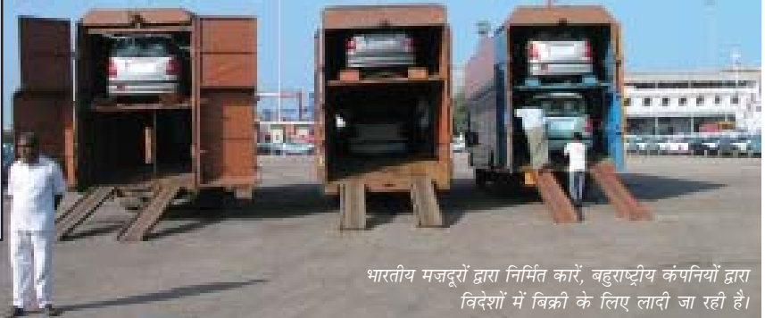
भारतीय मजदूरों द्वारा निर्मित कारें, बहुराष्ट्रीय कंपनियों द्वारा विदेशों में बिक्री के लिए लादी जा रही हैं।