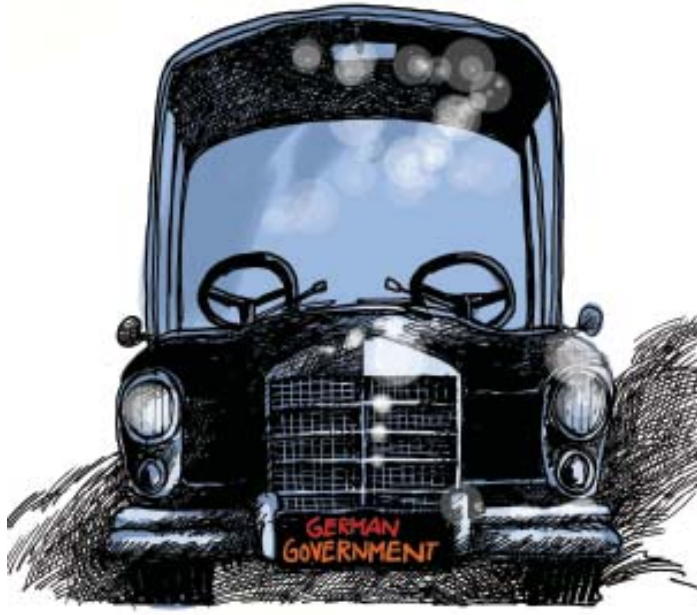
जर्मन इंजीनियरिंग का बेहतरीन नमूना...