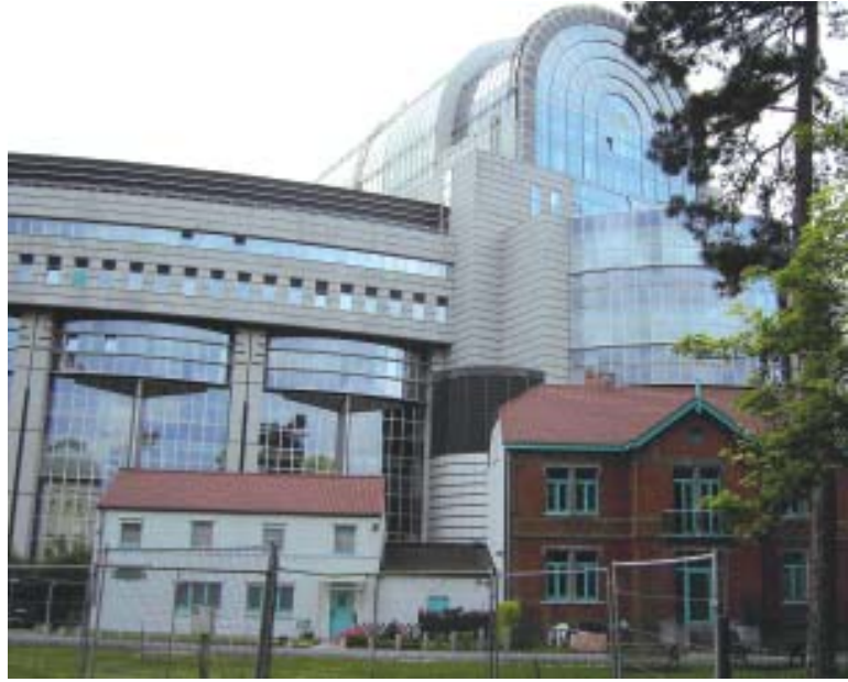
बेल्जियम में स्थित यूरोपीय संघ की संसद

आपको बेल्जियम का मॉडल कुछ जटिल लग सकता है। निश्चित रूप से यह जटिल है—खुद बेल्जियम में रहने वालों के लिए भी। पर यह व्यवस्था बेहद सफल रही है। इससे मुल्क में गृहयुद्ध की आशंकाओं पर विराम लग गया है वरना गृहयुद्ध की स्थिति में बेल्जियम भाषा के आधार पर दो टुकड़ों में बँट गया होता। जब अनेक यूरोपीय देशों ने साथ मिलकर यूरोपीय संघ बनाने का