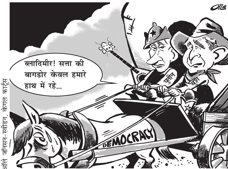
सत्ता की बागडोर

हाल के समय में रूस में कुछ नए कानून बने हैं। इन कानूनों को बनाकर रूस के राष्ट्रपति को कुछ और शक्तियाँ सौंपी गई हैं। इसी वक्त अमरीकी राष्ट्रपति ने रूस का दौरा किया था। ऊपर दिए गए कार्टून के अनुसार लोकतंत्र और सत्ता के केंद्रीकरण में क्या संबंध है? यहाँ जिस चीज़ को तरफ़ ध्यान खींचा गया है उसकी पुष्टि में क्या आप कुछ और कार्टून जुटा सकते हैं?