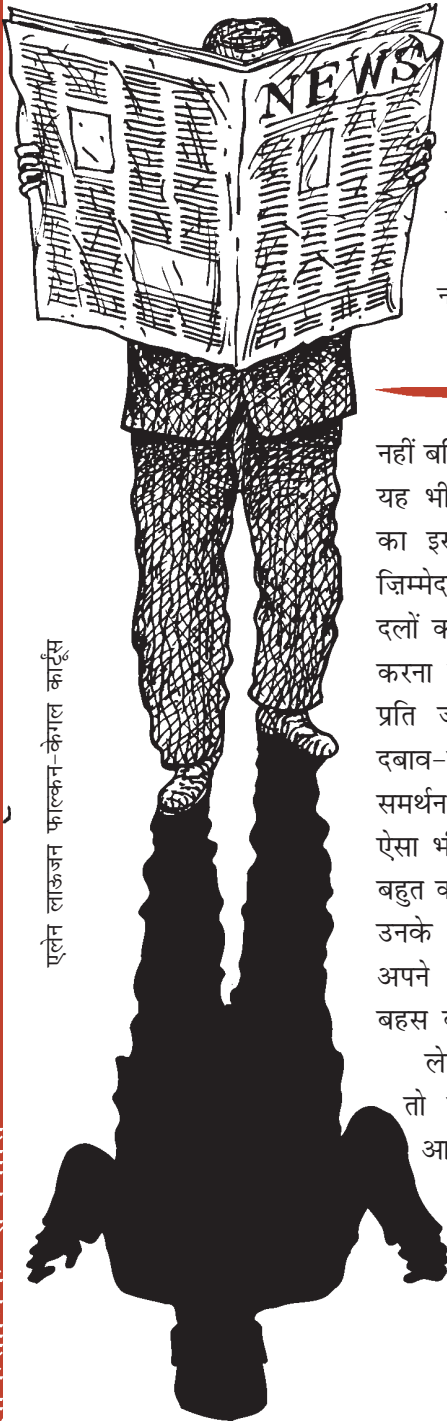
एलेन लाऊज़न फाल्कन-केगल कार्टूस

ऊपर के अनुच्छेद में आपको लोकतंत्र और सामाजिक आंदोलन में क्या संबंध नज़र आ रहा है? इस आंदोलन को सरकार के प्रति क्या रवैया अपनाना चाहिए?