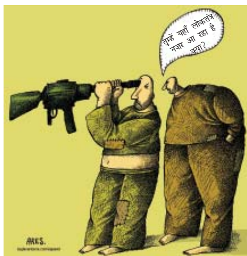
लोकतंत्र पर नज़र