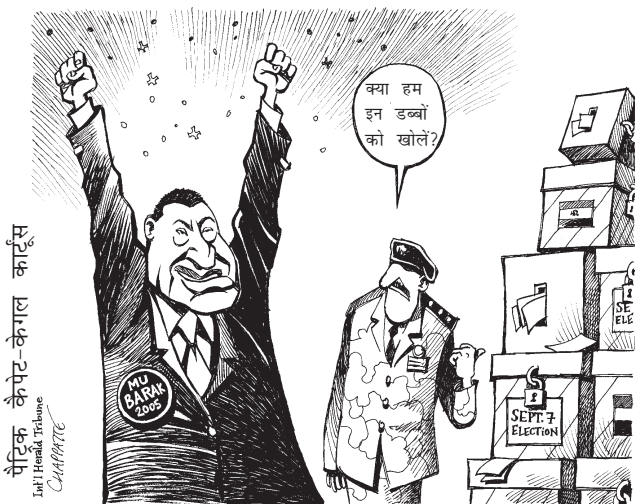
मुबारक फिर चुने गए