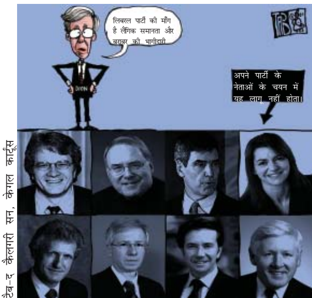
उदारवादी लैंगिक समानता