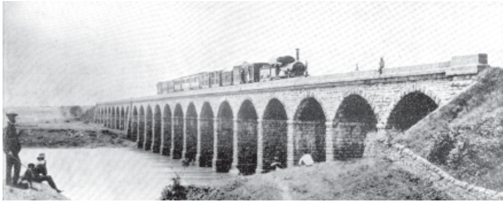
चित्र 1.4 बंबई तथा थाणे की जोड़ने वाला पहला रेल पुल, 1854

व्यावसायीकरण का भारतीय ग्रामीण अर्थव्यवस्थाओं के आत्मनिर्भरता के स्वरूप पर विपरीत प्रभाव पड़ा। भारत के निर्यात व्यापार की माँग में निःसंदेह विस्तार हुआ, परंतु इसके लाभ भारतवासियों को मुश्किल से ही प्राप्त हुए। इस प्रकार जनसामान्य को मिले सांस्कृतिक लाभ, व्यापक होते हुए भी, देश की आर्थिक हानि की भरपाई नहीं कर पाए।