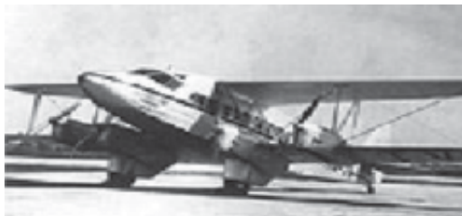
चित्र 1.5 टाटा एयरलाइंस: टाटा संस के विभाग के रूप में इस कंपनी की स्थापना से 1932 में भारत में उड्डयन क्षेत्र की नींव रखी गई

समय के आंतरिक जल मार्ग अलाभकारी सिद्ध हुए। उड़ीसा की तटवर्ती नहर इसका विशेष उदाहरण है। यद्यपि इस नहर का निर्माण सरकारी कोष से किया गया था, तथापि यह रेलमार्ग से स्पर्धा नहीं कर पाई। नहर के समानांतर रेलमार्ग विकसित होने के बाद अंततः उस जलमार्ग को छोड़ दिया गया। भारत में विकसित की गई महँगी तार व्यवस्था का मुख्य ध्येय तो कानून व्यवस्था को बनाए रखना ही था। दूसरी ओर डाक सेवाएँ अवश्य जनसामान्य को सुविधा प्रदान कर रही थीं, किंतु वे बहुत ही अपर्याप्त थीं। आधारिक सरचनाओं की वर्तमान अवस्था के विषय में आपको अध्याय-8 में विस्तृत जानकारी दी जाएगी।