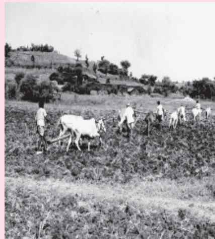
चित्र 1.1: ब्रिटिश औपनिवेशिक शासन के अंतर्गत भारत में कृषि में गतिहीनता

सत्रहवीं शताब्दी में भारत आए फ्रांसीसी यात्री बर्नीयर ने तत्कालीन बंगाल का इस प्रकार वर्णन किया है- “अपने दो बार के भ्रमण के दौरान बंगाल के विषय में संगृहीत जानकारी के आधार पर मैं कह सकता हूँ कि यह क्षेत्र मिश्र देश से कहीं अधिक समृद्ध है। यहाँ से सूती-रेशमी वस्त्र, चावल, शक्कर और मक्खन का प्रचुर मात्राओं में निर्यात होता है। यहाँ अपने आंतरिक उपभोग के लिए भी गेहूँ, सब्जियाँ, अनाज, मुर्गे/मुर्गियाँ, बत्तख आदि का भरपूर उत्पादन होता है। यहाँ सूअरों के बड़े-बड़े झुंड तथा भेड़-बकरियों के विशाल झुंड भी विद्यमान हैं। इस क्षेत्र में हर प्रकार की मछलियाँ प्रचुरता में उपलब्ध हैं। राजमहल से लेकर समुद्र तक अतीत में परिवहन तथा सिंचाई के लिए गंगा नदी से (बहुत यत्न और श्रमपूर्वक) काट कर बनाई गई नहरों का जाल-सा बिछा हुआ है।”