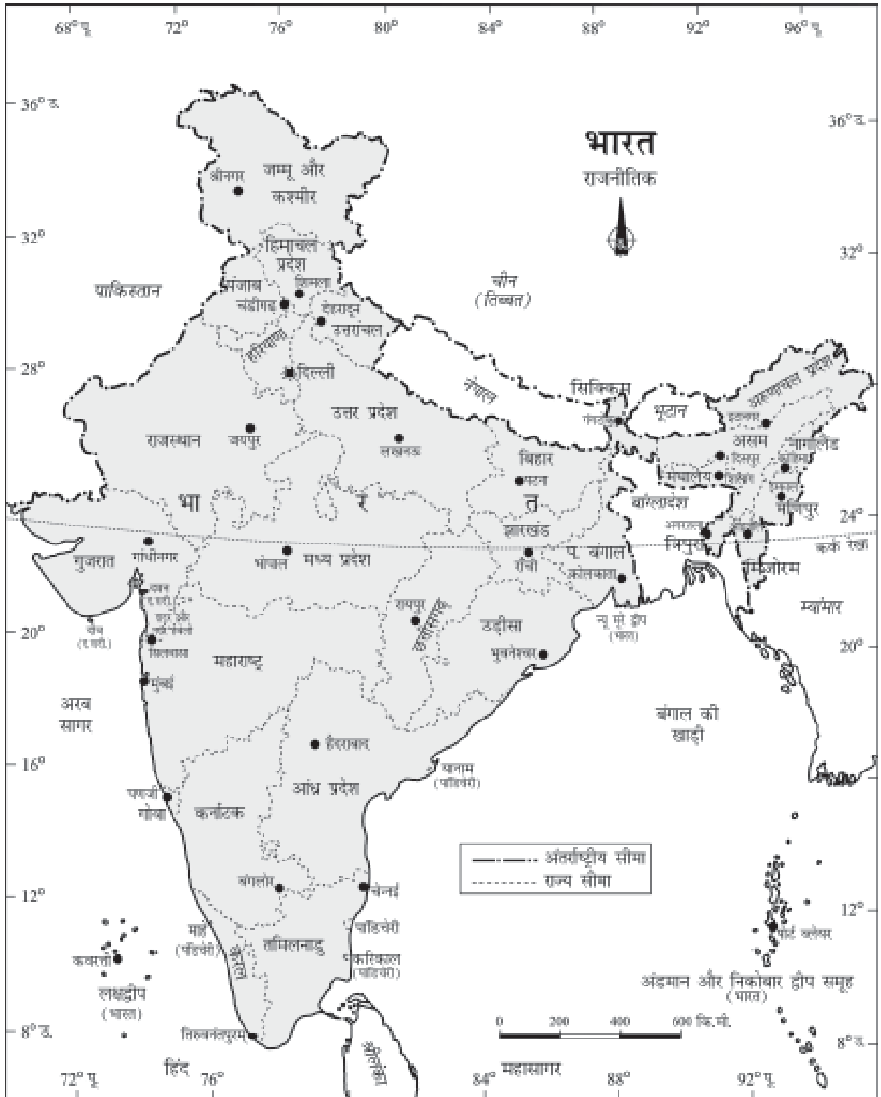
चित्र 1.1 : भारत : राजनीतिक