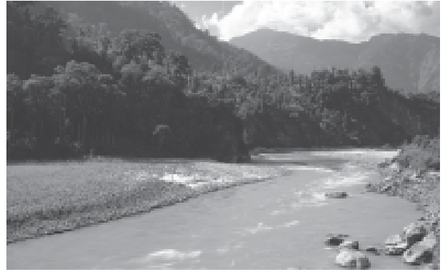
चित्र 3.1 : पर्वतीय क्षेत्र की एक नदी

दिशा से दूसरी दिशा में बहने का कारण बता सकते हैं? उत्तर में हिमालय तथा दक्षिण में पश्चिमी घाट