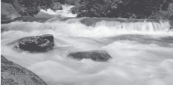
चित्र 3.3 : क्षिप्रिकाएँ

समतल घाटियों, गोखुर झीलें, बाढ़कृत मैदान, गुंफित वाहिकाएँ और नदी के मुहाने पर डेल्टा का निर्माण करती हैं। हिमालय क्षेत्र में इन नदियों का रास्ता टेढ़ा-मेढ़ा है, परंतु मैदानी क्षेत्र में इनमें सर्पाकार मार्ग में बहने की प्रवृत्ति पाई जाती है और अपना रास्ता बदलती रहती हैं। कोसी नदी, जिसे बिहार का शोक (Sorrow of Bihar) कहते हैं, अपना मार्ग बदलने के लिए कुख्यात रही है। यह नदी पर्वतों के ऊपरी क्षेत्रों से भारी मात्रा में अवसाद लाकर मैदानी भाग में जमा करती है। इससे नदी मार्ग अवरूद्ध हो जाता है व परिणामस्वरूप नदी अपना मार्ग बदल लेती है। कोसी नदी ऊपरी पर्वतीय क्षेत्र से इतनी भारी मात्रा में अवसाद क्यों लाती है? क्या आप सोचते हैं कि सामान्यतः नदियों में और विशेष तौर पर कोसी नदी में जल का बहाव व मात्रा एक समान रहती है या घटती-बढ़ती रहती है? नदी में कब जल की मात्रा अत्यधिक होती है? बाढ़ के सकारात्मक व नकारात्मक प्रभाव क्या हैं?