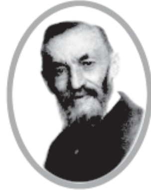
G. Peano (1858-1932)

निगमन के विपरीत, आगमन तर्क प्रत्येक स्थिति के अध्ययन पर आधारित होता है तथा इसमें प्रत्येक एवं हर संभव स्थिति को ध्यान में रखते हुए घटनाओं के निरीक्षण द्वारा एक अनुमानित कथन विकसित किया जाता है। इसको गणित में प्रायः प्रयोग किया जाता है तथा वैज्ञानिक चिंतन, जहाँ आँकड़ों का संग्रह तथा विश्लेषण मानक होता है, का यह मुख्य आधार है। इस प्रकार, सरल भाषा में हम कह सकते हैं कि आगमन शब्द का अर्थ विशिष्ट स्थितियों या तथ्यों से व्यापकीकरण करने से है।