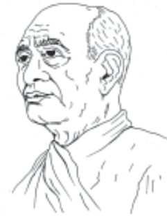
- सरदार पटेल, संविधान सभा वाद-विवाद, खंड. आठ, पृ.272