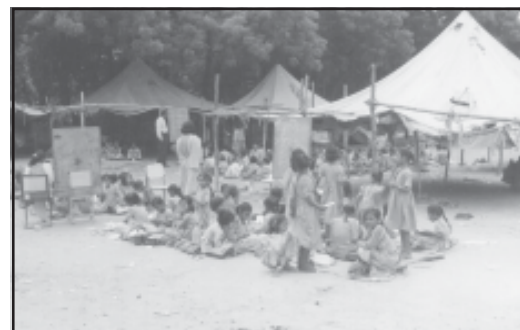
चित्रों की विवेचना करें