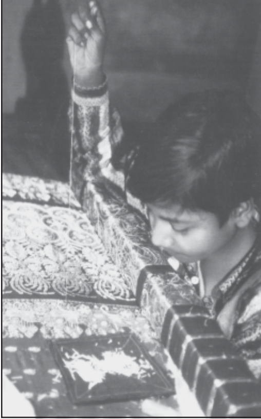
चित्र की विवेचना करें

महत्त्वपूर्ण क्रियाविधि है। इसे एक व्यक्ति को खुद को साबित करने का क्षेत्र भी माना जाता है और इसीलिए विभिन्न प्रस्थितियों के लिए चयन