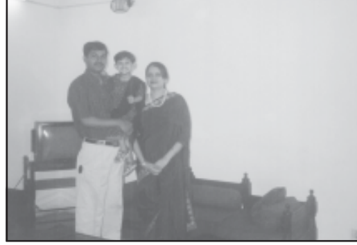
परिवारों और आवासों में अंतर पर ध्यान दीजिए