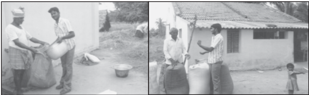
गाँव में धान की कटाई