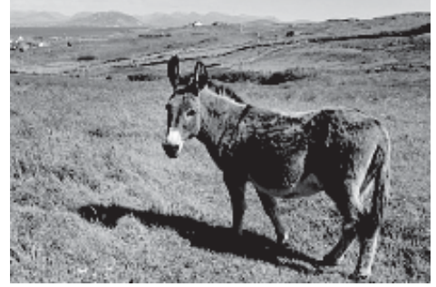
चित्र 9.2 खच्चर

के वांछनीय गुण सम्मिलित हो जाते हैं तथा इस संतति का पर्याप्त आर्थिक महत्त्व होता है; जैसे- खच्चर (चित्र 9.2)। क्या आप जानते हैं कि खच्चर की उत्पत्ति किस संकरण का परिणाम है?