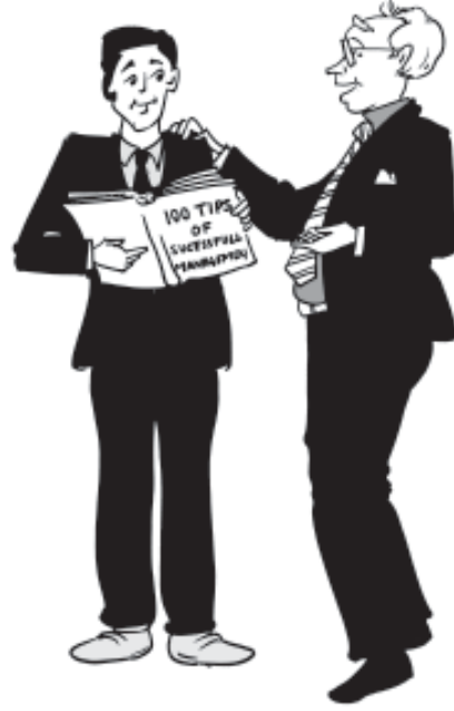
चित्र 1.3—आप सिर्फ किताबें पढ़कर प्रबंधन नहीं सीख सकते।

योजनाओं को पूरा करना होता है। इसके लिए (क) उच्च प्रबंधकों द्वारा बनाई गई योजना की व्याख्या करते हैं; (ख) अपने विभाग के लिए पर्याप्त संख्या में कर्मचारियों को सुनिश्चित करते हैं; (ग) उन्हें आवश्यक कार्य एवं दायित्व सौंपते हैं; (घ) इच्छित उद्देश्यों की प्राप्ति हेतु अन्य विभागों से सहयोग करते हैं। इसके साथ-साथ वे प्रथम पंक्ति के प्रबंधकों के कार्यों के लिए उत्तरदायी होते हैं।