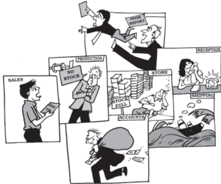
चित्र 1.5—समन्वय के न रहने से असमंजस होगा।

संगठन की क्रियाओं के समन्वय की प्रक्रिया, नियोजन से ही प्रारंभ हो जाती है। उच्च प्रबंध पूरे संगठन के लिए योजना बनाता है। इन योजनाओं के अनुसार संगठन ढाँचों को विकसित