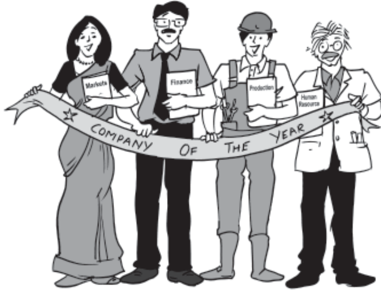
चित्र 1.1—टीम में साथ होने से प्रत्येक अधिक कार्य करता है।