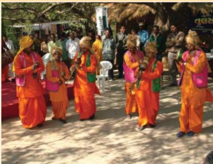
बीन पार्टी के बाजे

को बुरी हालत में रखते हैं। चाहते तो हम भी साँपों को मारकर खूब पैसा कमा सकते थे। तब हमारी जिंदगी इतनी मुश्किल भरी न होती। साँपों को मारने की बात तो दूर, ये तो हमारी पूँजी हैं जो हम अपनी आने वाली पीढ़ी को सौंपते हैं। साँपों को तो हम अपनी बेटियों को शादी में तोहफ़े के रूप में भी देते हैं। हमारे कालबेलिया नाच में भी साँप जैसी मुद्राएँ होती हैं।