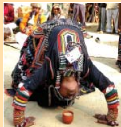
कालबेलिया नाच की एक मुद्रा