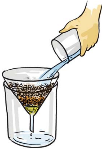
चित्र 18.2 वातित द्रव को फिल्टर करने का प्रक्रम