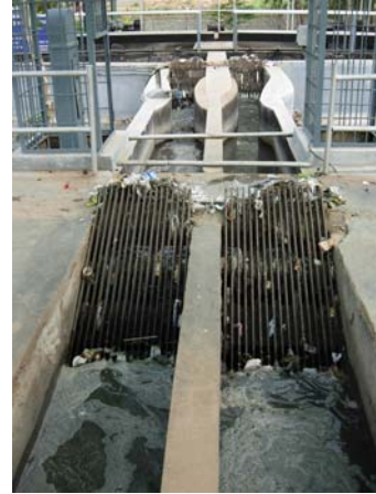
चित्र 18.3 शलाका छन्ने