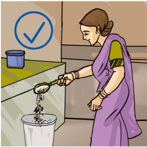
चित्र 18.7 हर कचरे को सिंक में मत फेंकिए

मल, स्वास्थ्य संकट का एक कारक है। इससे जल और मृदा का प्रदूषण हो सकता है। सतह पर उपलब्ध जल और भौमजल दोनों मानव मल से प्रदूषित हो जाते हैं। 'भौमजल' कुँओं, ट्यूबवैल (नलकूपों), झरनों और अनेक नदियों के लिए जल का स्रोत है, जैसा कि आपने अध्याय 16 में पढ़ा था। अतः अनुपचारित मानव मल, जल जनित रोगों का सबसे सुगम पथ बन जाता