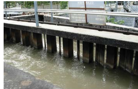
चित्र 18.4 ग्रिट और बालू अलग करने की टंकी