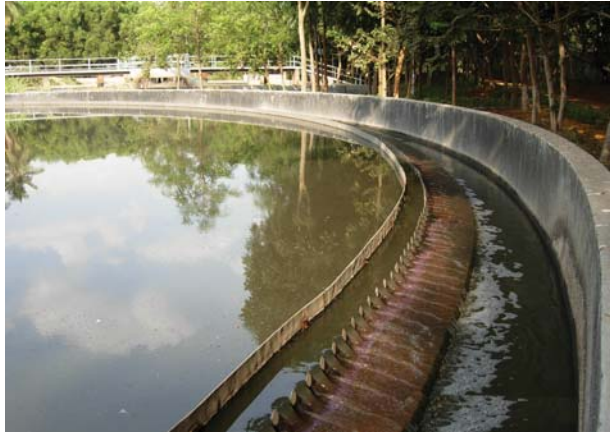
चित्र 18.5 जल अपमथित्र

आपंक को एक पृथक् टंकी में स्थानांतरित किया जाता है, जहाँ यह अवायवीय जीवाणुओं द्वारा अपघटित हो जाता है। इस प्रक्रम में उत्पन्न होने वाली बायोगैस (जैव गैस) का उपयोग ईंधन के रूप में अथवा विद्युत उत्पादन के लिए किया जा सकता है।