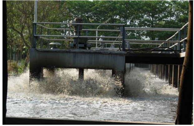
चित्र 18.6 वातित्र

कई घंटों के पश्चात् जल में निलंबित सूक्ष्मजीव टंकी की पेंदी में सक्रियित आपंक के रूप में बैठ जाते हैं। अब शीर्ष भाग से जल को निकाल दिया जाता है। सक्रियित आपंक लगभग 97% जल है। जल को बालू बिछाकर बनाए शुष्कन तलों अथवा मशीनों द्वारा हटा दिया जाता है। शुष्क आपंक का उपयोग खाद के रूप में किया जाता है, जिससे कार्बनिक पदार्थ और पोषक तत्व पुनः मृदा में वापस चले जाते हैं।