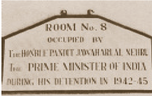
अहमदनगर किले का वह कक्ष जहाँ 1942-45 में जवाहरलाल नेहरू को रखा गया