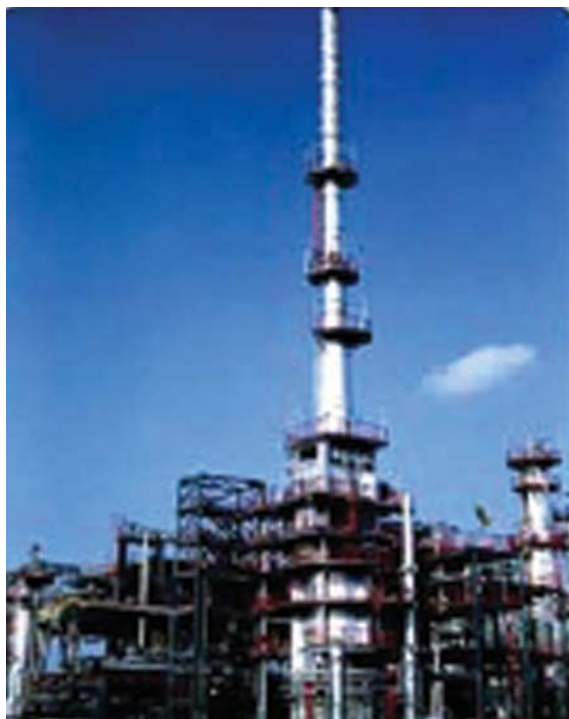
चित्र 5.5 : पेट्रोलियम परिष्करण।

को पृथक करने का प्रक्रम परिष्करण कहलाता है। यह कार्य पेट्रोलियम परिष्करण में सम्पादित किया जाता है (चित्र 5.5)।