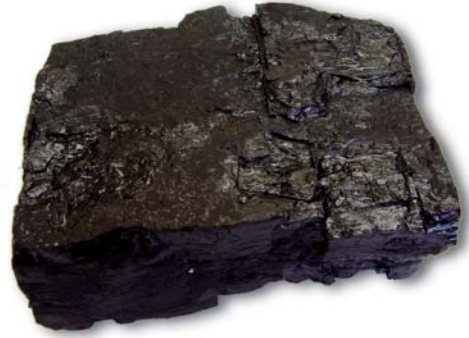
चित्र 5.1 : कोयला।

आपने कोयला देखा होगा या इसके बारे में सुना होगा (चित्र 5.1)। यह पत्थर जैसा कठोर और काले रंग का होता है।