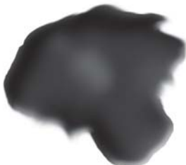
चित्र 5.3 : कोलतार।

यह एक अप्रिय गंध वाला काला गाढ़ा द्रव होता है (चित्र 5.3)। यह लगभग 200 पदार्थों का मिश्रण