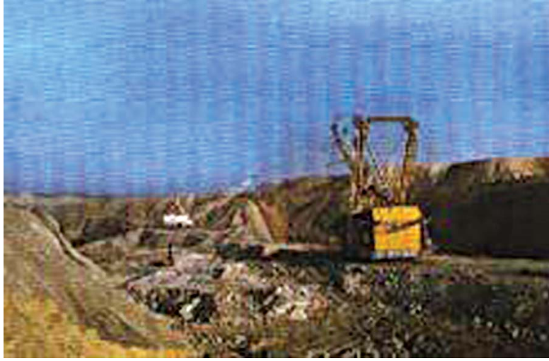
चित्र 5.2 : कोयले की एक खान।

वायु में गर्म करने पर कोयला जलता है और मुख्य रूप से कार्बन डाइऑक्साइड गैस उत्पन्न करता है।