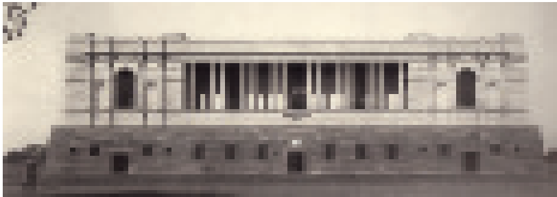
चित्र 4 - भारतीय राष्ट्रीय अभिलेखागार 1920 के दशक में बनाया गया।

उन्हें खुशनवीसी के माहिर लिखते थे। खुशनवीसी या सुलेखनवीस ऐसे लोग होते हैं जो बहुत सुंदर ढंग से चीजें लिखते हैं। उन्नीसवीं सदी के मध्य तक छपाई