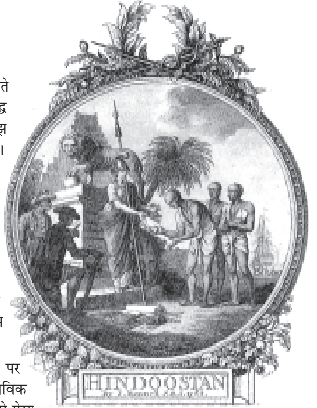
चित्र 1 – ब्राह्मण ब्रिटेनिया को शास्त्र भेंट कर रहे हैं, जेम्स रेनेल द्वारा तैयार किए गए पहले नक्शे का आवरण चित्र, 1782.

रोजमर्रा की जिंदगी में हम अपने आसपास की चीजों पर हमेशा ऐतिहासिक सवाल नहीं उठाते। हम चीजों को स्वाभाविक मानकर चलते हैं। मानो जो कुछ हमें दिख रहा है वह हमेशा से ऐसा ही रहा हो। लेकिन हम सबके सामने कभी-कभी अचभे के क्षण आते हैं। कई बार हम उत्सुक हो जाते हैं और ऐसे सवाल पूछते हैं जो वाकई ऐतिहासिक होते हैं। किसी व्यक्ति को सड़क किनारे चाय के घूंट भरते देखकर आप इस बात पर हैरान हो सकते हैं कि चाय या कॉफी पीने का चलन शुरू कब से हुआ होगा? रेलगाड़ी की खिड़की से बाहर झाँकते हुए आपके जहन में यह सवाल उठ सकता है कि रेलवे का निर्माण कब हुआ? रेलगाड़ी के आने से पहले लोग दूर-दूर की यात्रा किस तरह कर पाते थे? सुबह-सुबह अख़बार पढ़ते हुए आप यह जानने के लिए उत्सुक हो सकते हैं कि जिस ज़माने में अख़बार नहीं छपते थे, उस समय लोगों को चीजों की जानकारी कैसे मिलती थी।