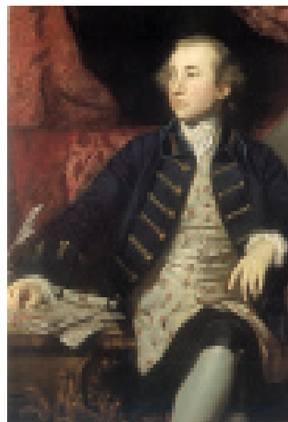
चित्र 3 - वॉरेन हेस्टिंग्स 1773 में भारत के पहले गवर्नर-जनरल बने।

मिल को लगता था कि सारे एशियाई समाज सभ्यता के मामले में यूरोप से पीछे हैं। इतिहास की उनकी समझदारी ये थी कि भारत में अंग्रेज़ों के आने से पहले यहाँ हिंदू और मुसलमान तानाशाहों का ही राज चलता था। यहाँ चारों ओर केवल धार्मिक बैर, जातिगत बंधनों और अंधविश्वासों का ही बोलबाला