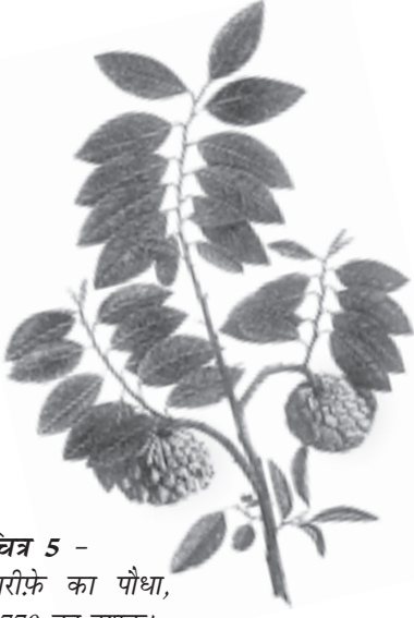
चित्र 5 - शरीफे का पौधा, 1770 का दशक।

अंग्रेजों द्वारा बनाए गए वानस्पतिक उद्यान और प्राकृतिक इतिहास के संग्रहालयों में विभिन्न पौधों के नमूने और उनसे संबंधित जानकारीयों इकट्ठा की जाती थीं। इन नमूनों के चित्र स्थानीय कलाकारों से बनवाए जाते थे। अब इतिहासकार इस बात पर ध्यान दे रहे हैं कि इस तरह की जानकारी किस तरह इकट्ठा की जाती थी और इससे उपनिवेशवाद के बारे में क्या पता चलता है।