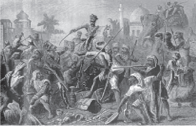
चित्र 7 - 1857 के विद्रोही।

तसवीरों को भी बहुत ध्यान से देखना चाहिए। उनसे हमें चित्रकार की सोच पता चलती है। 1857 के विद्रोह के बाद अंग्रेजों द्वारा तैयार की गई सचित्र पुस्तकों में यह तसवीर कई जगह दिखाई देती है। इस तसवीर के नीचे लिखा होता था : “बागी सिपाही लूट-खसोट में लगे हुए हैं”। अंग्रेजों की नज़र में विद्रोही जनता लालची, दुष्ट और बेरहम थी। इस विद्रोह के बारे में आप अध्याय 5 में पढ़ेंगे।