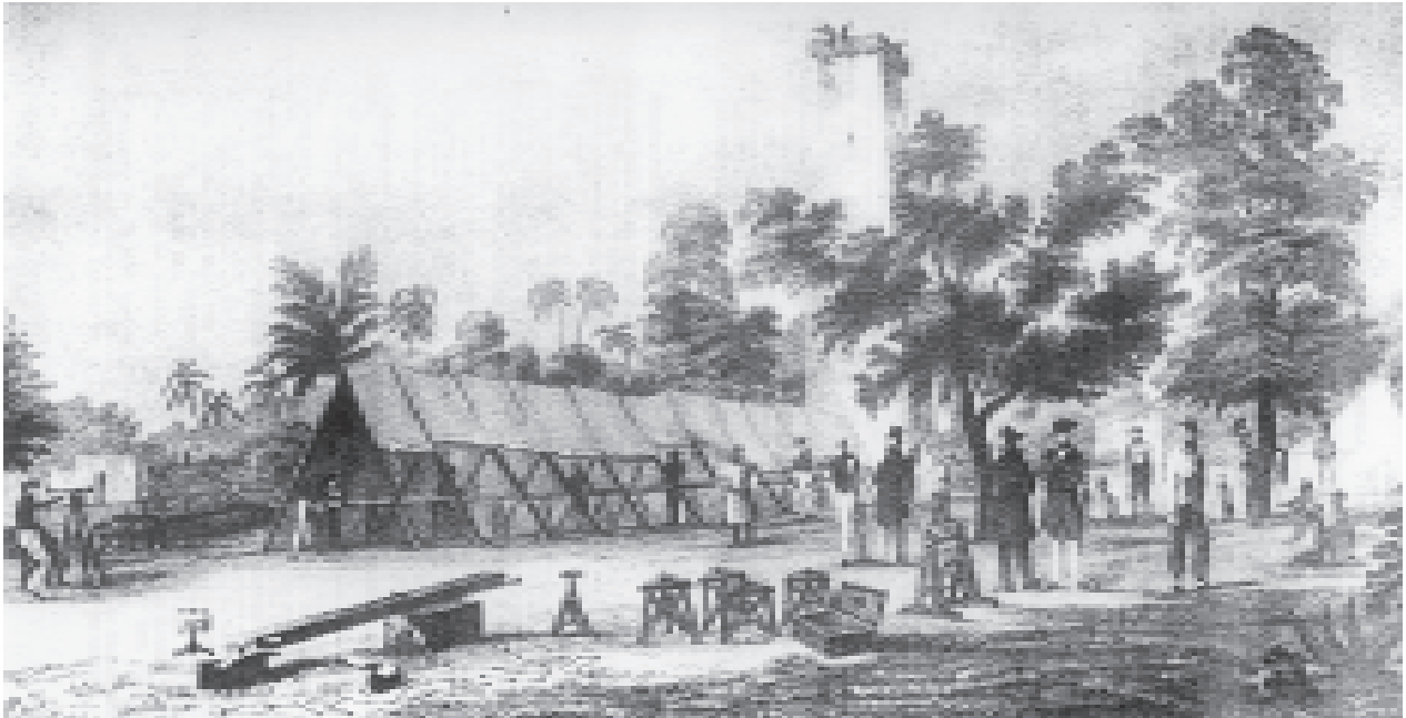
चित्र 6 - बंगाल में मानचित्रण और सर्वेक्षण कार्य चल रहा है। जेम्स प्रिंसेप द्वारा बनाई गई तसवीर, 1832.

रिकॉर्ड्स के इस विशाल भंडार से हम बहुत कुछ पता लगा सकते हैं। फिर भी, इस बात को नज़रअंदाज़ नहीं किया जा सकता कि ये सारे सरकारी