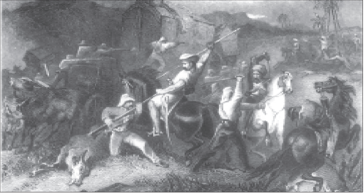
चित्र 4 - कैवेलरी लाइनों में युद्ध।

3 जुलाई 1857 को 3,000 से ज्यादा विद्रोही बरेली से दिल्ली आ पहुँचे। उन्होंने यमुना को पार किया और ब्रिटिश कैवेलरी चौकियों पर धावा बोल दिया। यह युद्ध पूरी रात चलता रहा।