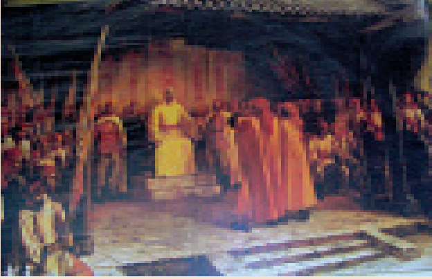
चित्र 11 - ताइपिंग की सेना अपने नेता से मिलते हुए

जब 1857 में भारत में विद्रोह फैला उसी समय चीन के दक्षिणी भागों में भी एक विशाल जनविद्रोह पैदा हो रहा था। यह विद्रोह 1850 में शुरू हुआ और 1860 के मध्य में जाकर खत्म हुआ। हाँग जिंकुआंग के नेतृत्व में हजारों मेहनतकश, गरीब लोगों ने परम शांति के स्वर्गिक साम्राज्य की स्थापना के लिए लड़ाई लड़ी। इस विद्रोह को ताइपिंग विद्रोह के नाम से जाना जाता है।