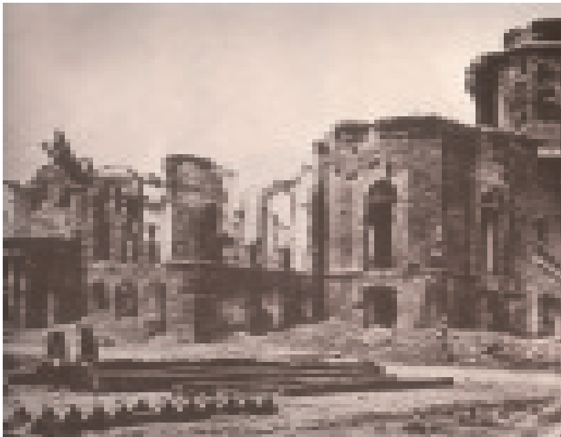
चित्र 12 - लखनऊ रेज़िडेंसी के खण्डहर।

जून 1857 में विद्रोही टुकड़ियों ने रेज़िडेंसी को कब्जे में ले लिया। बहुत सारी अंग्रेज़ औरतों, मर्दों और बच्चों ने रेज़िडेंसी की इमारतों में पनाह ली हुई थी। विद्रोहियों ने इस पूरे परिसर को घेरकर उन पर गोलों से हमला किया। इसी तरह के एक गोले से अवध के चीफ़ कमिश्नर हेनरी लॉरेंस की भी मौत हो गई थी। हेनरी लॉरेंस जिस कमरे में मरे वह इस चित्र में दिखाई दे रहा है। ग़ौर से देखें कि इमारतों पर बीते दौर के निशान किस तरह बचे रह जाते हैं।