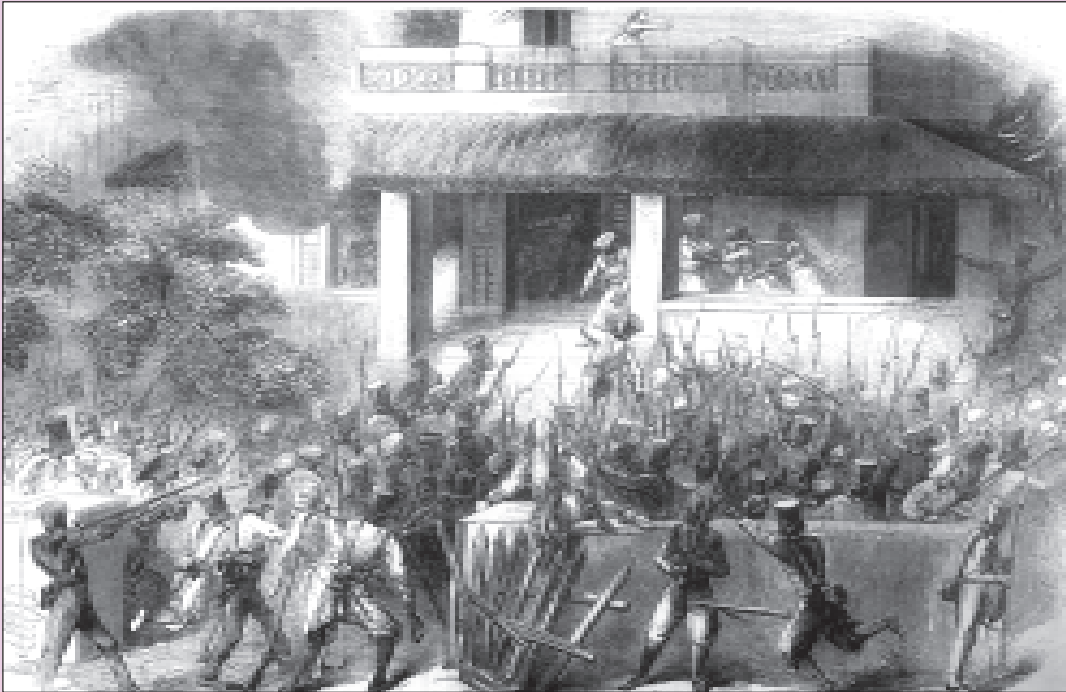
चित्र 3 - मेरठ में विद्रोही सिपाही अफसरों पर हमला करते हैं, उनके घरों में घुस जाते हैं और इमारतों में आग लगा देते हैं।

मेरा मानना है कि अवध पर हुए कब्ज़े से सिपाहियों के भीतर गहरा अविश्वास भर गया था और वे सरकार के खिलाफ़ साज़िशें रचने लगे थे। अवध के नवाब और दिल्ली बादशाह के नुमाइंदों को सेना की नब्ज़ जानने के लिए पूरे भारत में भेज दिया गया। उन्होंने सिपाहियों की भावनाओं को और हवा दी। उन्होंने सिपाहियों को बताया कि विदेशियों ने बादशाह के साथ कितना बड़ा धोखा किया है। उन्होंने हज़ार झूठ गढ़ डाले और सिपाहियों को अपने मालिकों, अंग्रेज़ों के खिलाफ़ बगावत करने के लिए उकसाया ताकि दिल्ली में बादशाह को दोबारा गद्दी पर बैठाया जा सके। उनकी दलील थी कि अगर सिपाही मिलकर काम करें और इन सुझावों पर अमल करें तो सेना ऐसा कर सकती है।