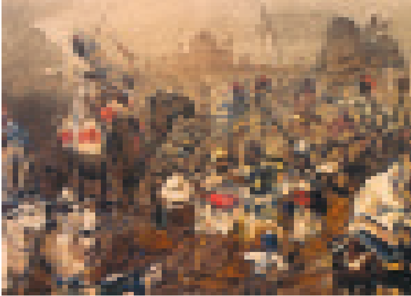
चित्र 1 - सिपाही और किसान विद्रोह के लिए ताकत जुटाते हैं। यह विद्रोह 1857 में उत्तर भारत के मैदानों में फैल गया था।