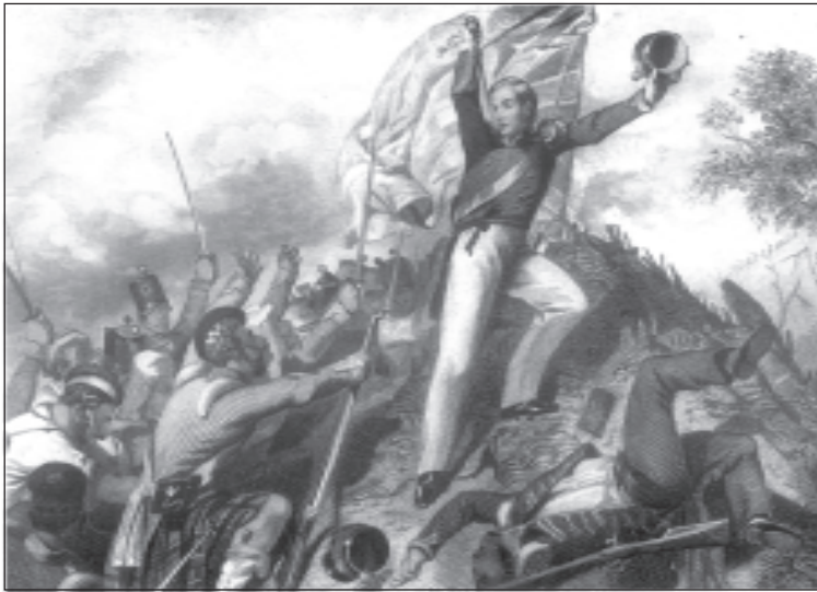
चित्र 9 - अंग्रेज टुकड़ियाँ कानपुर के पास विद्रोहियों को पकड़ लेती हैं।

का विश्वास जीतने के लिए हर संभव प्रयास किया। उन्होंने वफ़ादार भूस्वामियों के लिए ईनामों का ऐलान कर दिया। उन्हें आश्वासन दिया गया कि उनकी ज़मीन पर उनके परंपरागत अधिकार बने रहेंगे। जिन्होंने विद्रोह