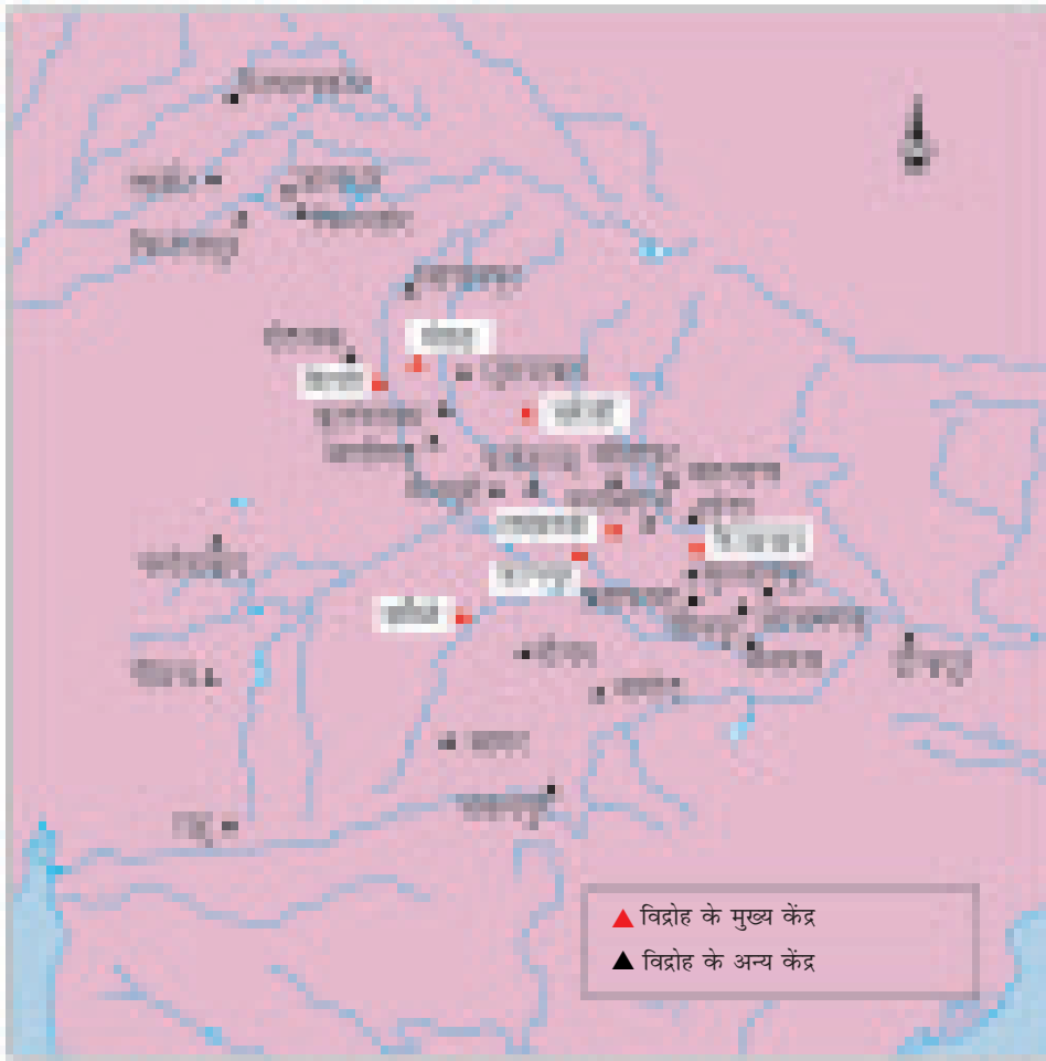
चित्र 10 - उत्तरी भारत में विद्रोह के कुछ प्रमुख केंद्र।

4. मुसलमानों की ज़मीन और संपत्ति बड़े पैमाने पर ज़ब्त की गई। उन्हें संदेह व शत्रुता के भाव से देखा जाने लगा। अंग्रेजों को लगता था कि यह विद्रोह उन्होंने ही खड़ा किया था।